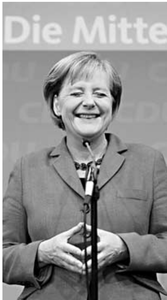
Merkel reconoció que se sentía feliz por los resultados

«Es un día amargo y una derrota amarga, no hay modo de embellecer eso»